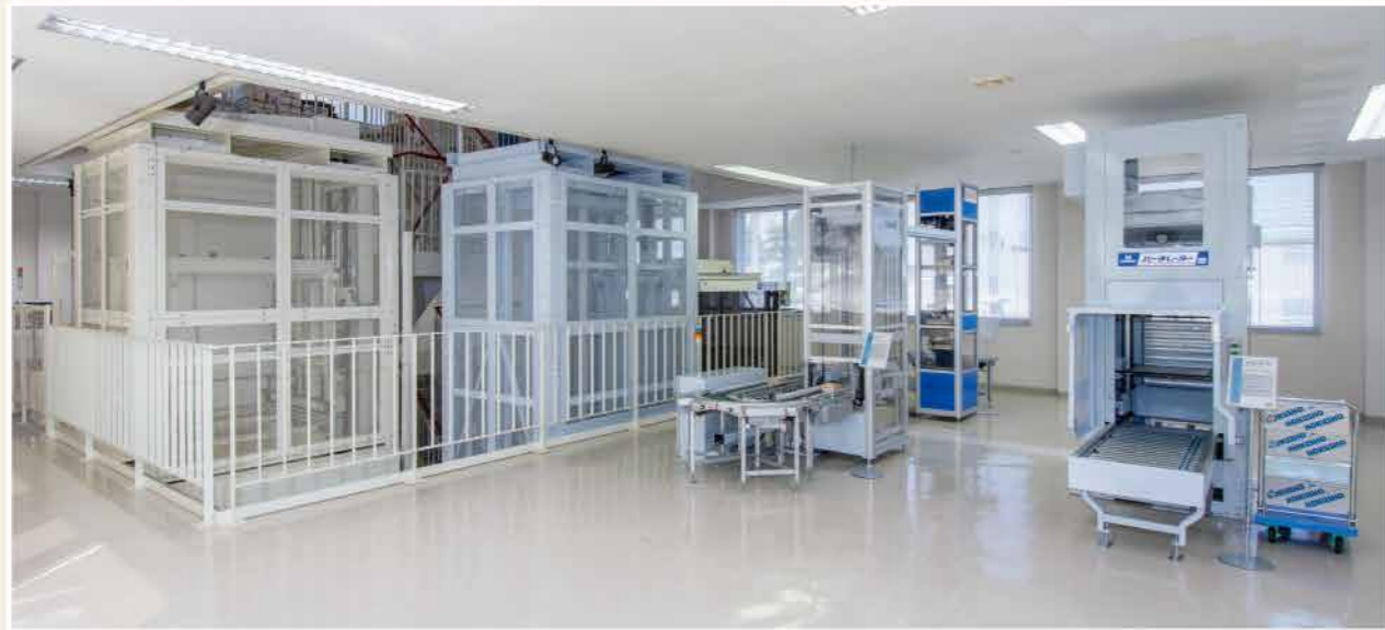
1F展示フロア(天井高2,790mm)