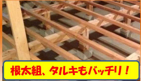
根太組、タルキもバッチリ!