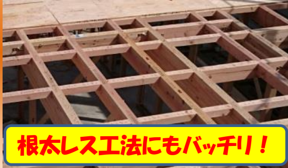
根太レス工法にもバッチリ!